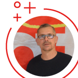
Frédéric PLOUVIN Reprographie