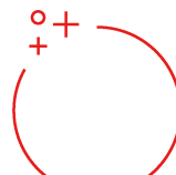
Séverine COURBY DHB